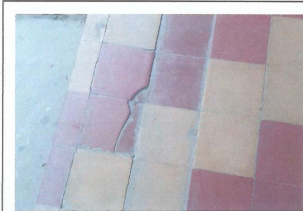
Foto1: Piso dañado